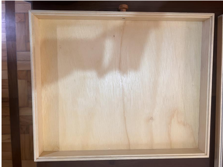
4.1.8.2. Item 01 – Gaveta entomológica – vista interna (com fundo)