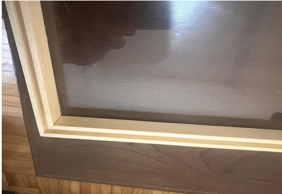
4.1.8.4. Item 01 – Gaveta entomológica – detalhe da tampa com encaixe fêmea