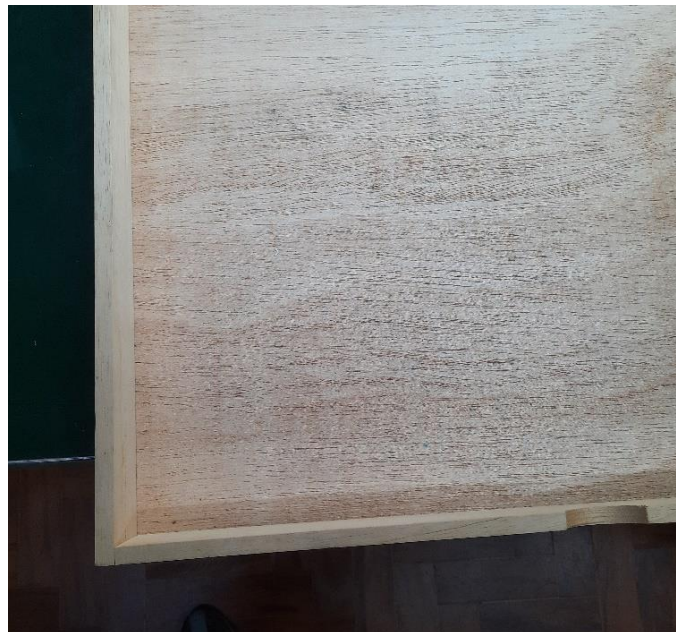
4.2.6.3. Item 02 – Gaveta de madeira da coleção em via seca de aves e de mamíferos – vista interna (com fundo)