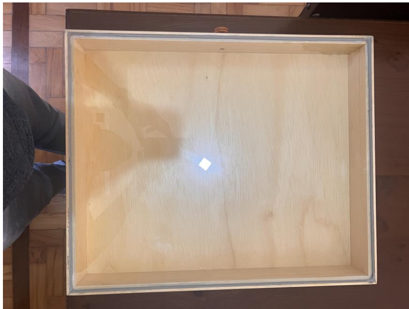
4.1.8.1. Item 01 – Gaveta entomológica – vista superior