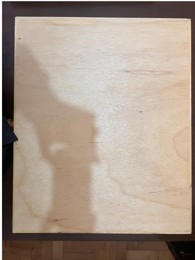
4.1.8.7. Item 01 – Gaveta entomológica – vista inferior (fundo)