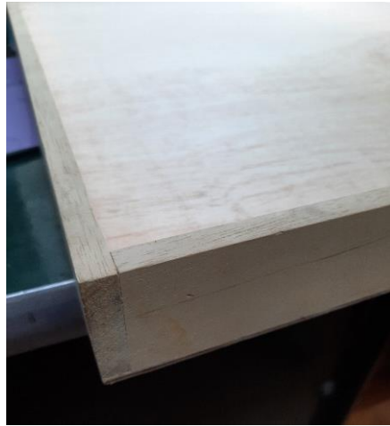
4.2.6.2. Item 02 – Gaveta de madeira da coleção em via seca de aves e de mamíferos – detalhe da junção