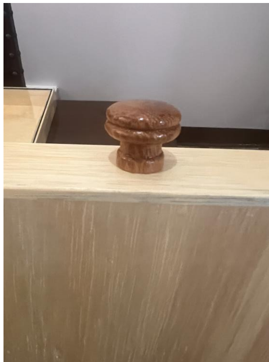
4.1.8.5. Item 01 – Gaveta entomológica – detalhe do puxador (parte externa)