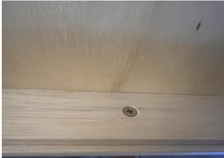
4.1.8.6. Item 01 – Gaveta entomológica – detalhe do puxador (fixação interna)