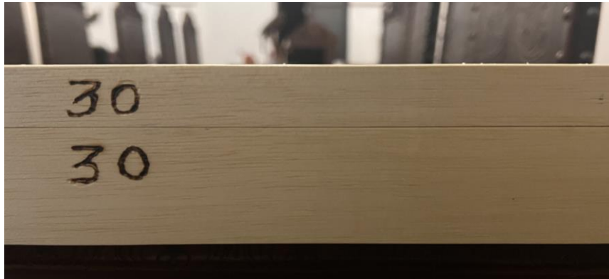
4.1.8.8. Item 01 – Gaveta entomológica – numeração da tampa e do corpo da gaveta (a numeração inicia-se com 01)