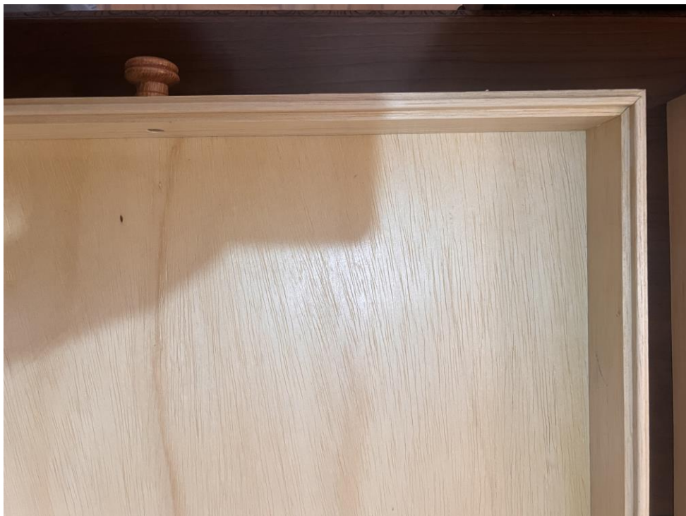
4.1.8.3. Item 01 – Gaveta entomológica – detalhe do encaixe macho