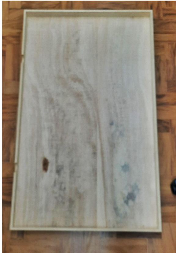
4.2.6.1. Item 02 – Gaveta de madeira da coleção em via seca de aves e de mamíferos – vista superior