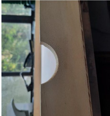
4.2.6.4. Item 02 – Gaveta de madeira da coleção em via seca de aves e de mamíferos – detalhe puxador