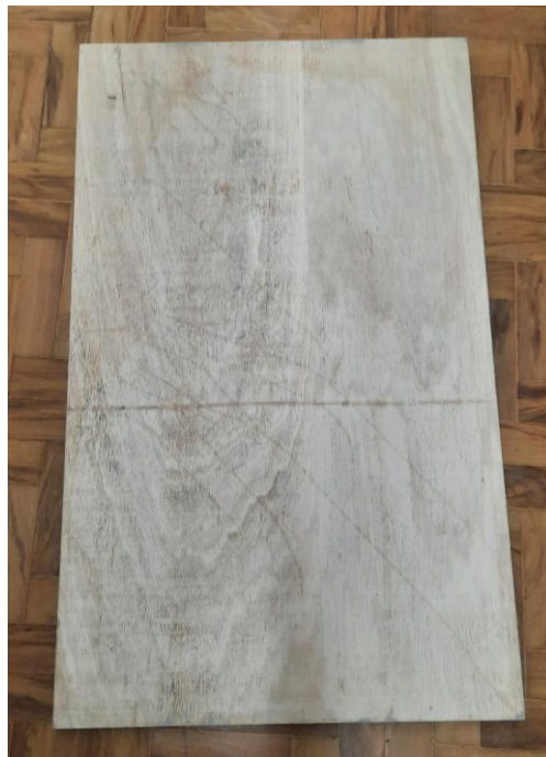
4.2.6.5. Item 02 – Gaveta de madeira da coleção em via seca de aves e de mamíferos – vista inferior (fundo)