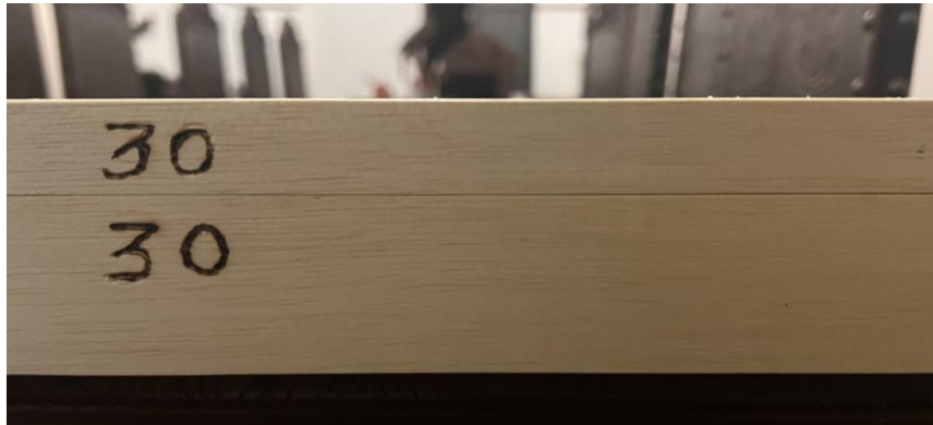
4.1.8.8. Item 01 – Gaveta entomológica – numeração da tampa e do corpo da gaveta (a numeração inicia-se com 01)